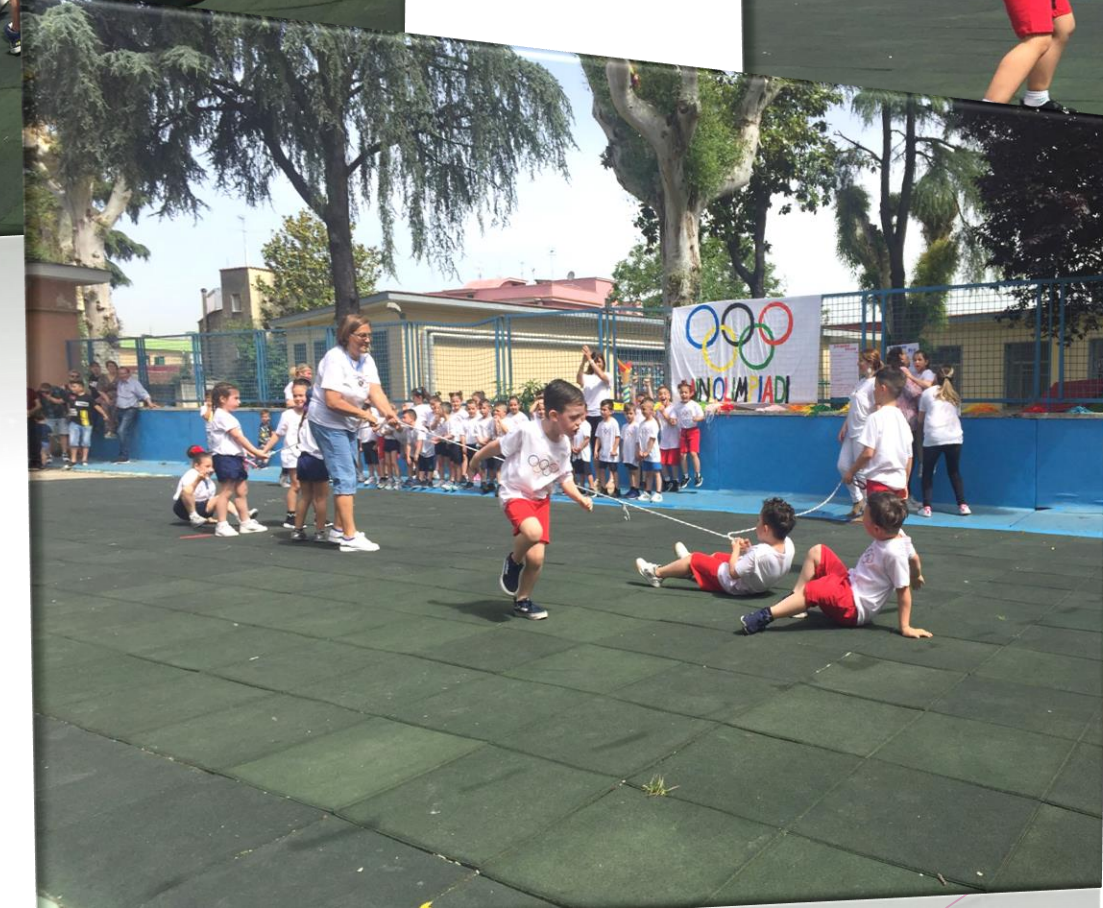
Tiro della corda