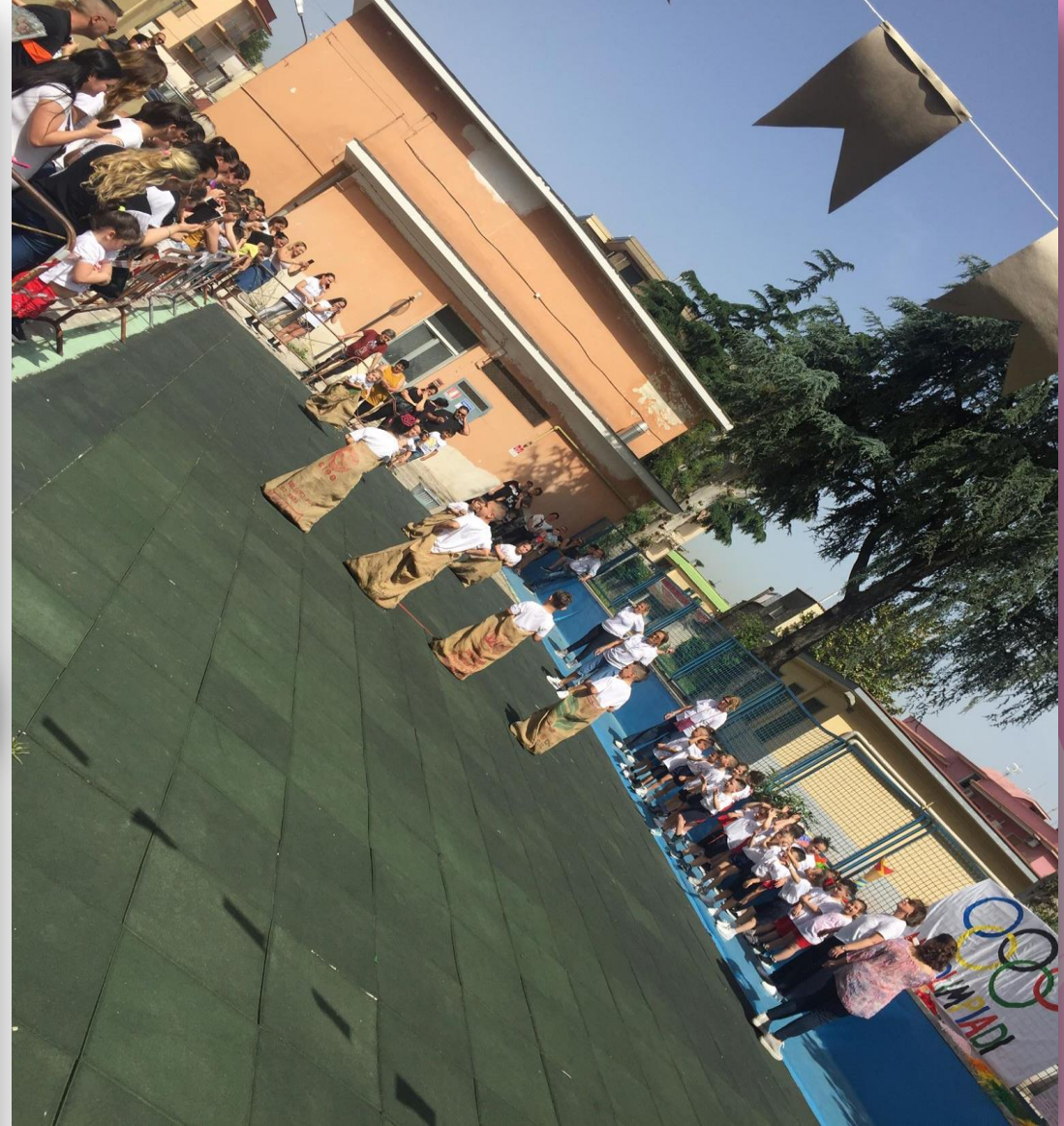
Corsa con i sacchi